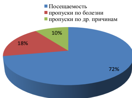
Посещаемость за период сентябрь-май 2014-2015 уч.год

За 2014-2015 учебный год в дошкольном отделении образовательного комплекса проводились следующие формы методической работы: